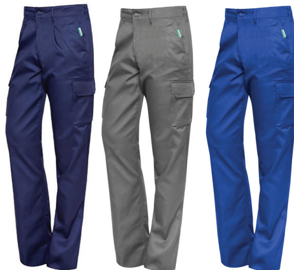
09 Gris 11 Azulina 57 Marino