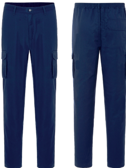
07 Marino 09 Gris