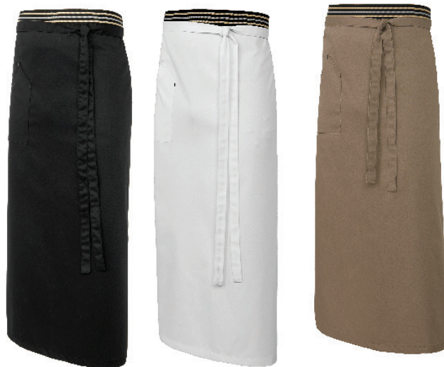
C.01 C.10 C.705 Negro Blanco Vison