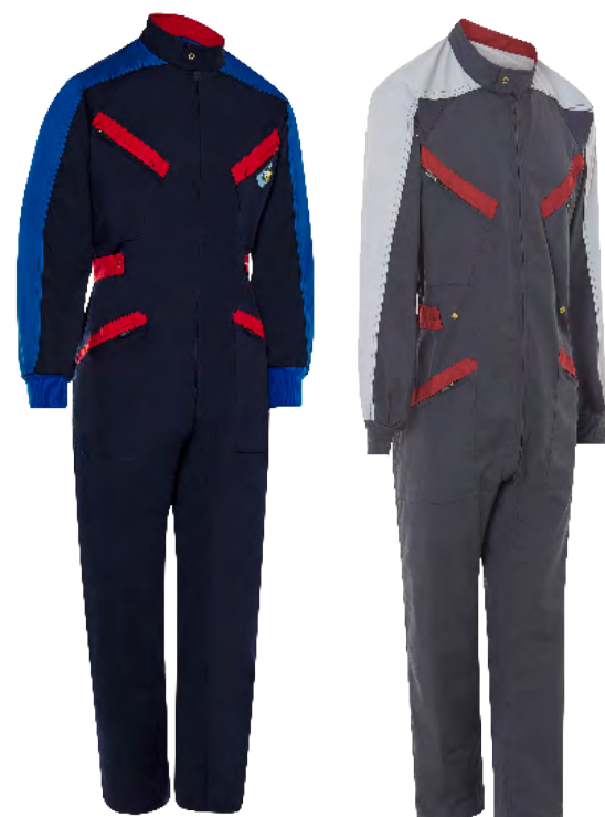
ref. 125 TRICOLOR CONFORT FIT