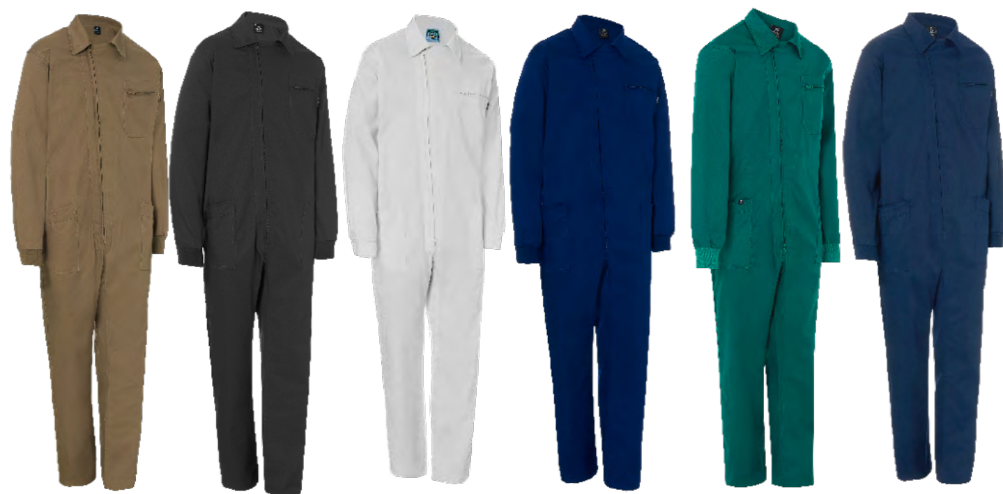
ref. 1111 CONFORT FIT