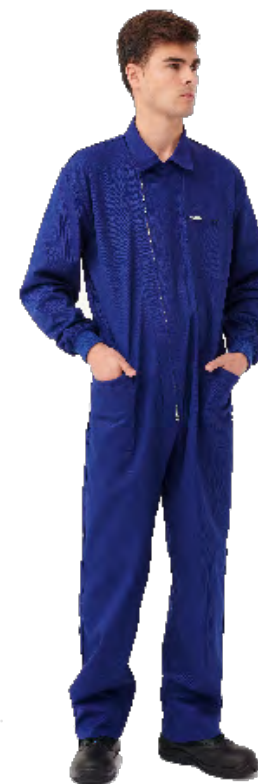
ref. 1110 CONFORT FIT