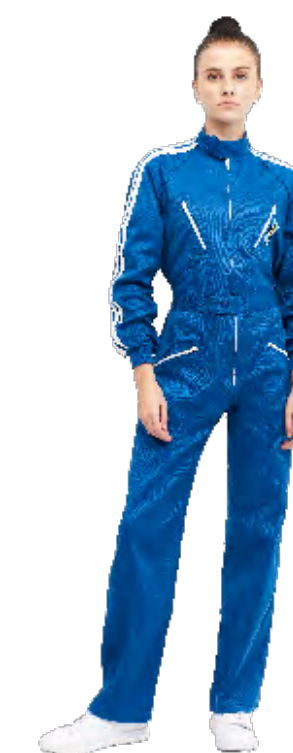
ref. 122 CONFORT FIT