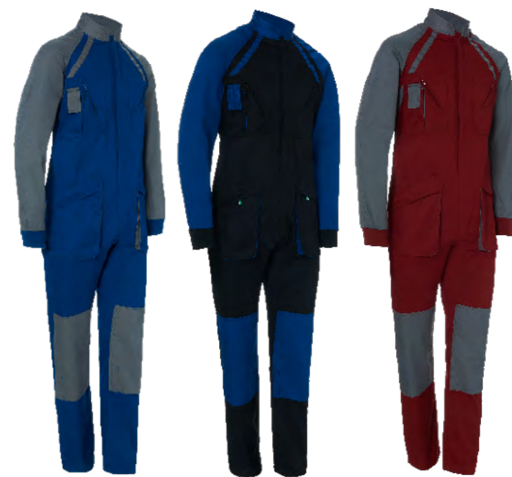
ref. 1128 BICOLOR CONFORT FIT