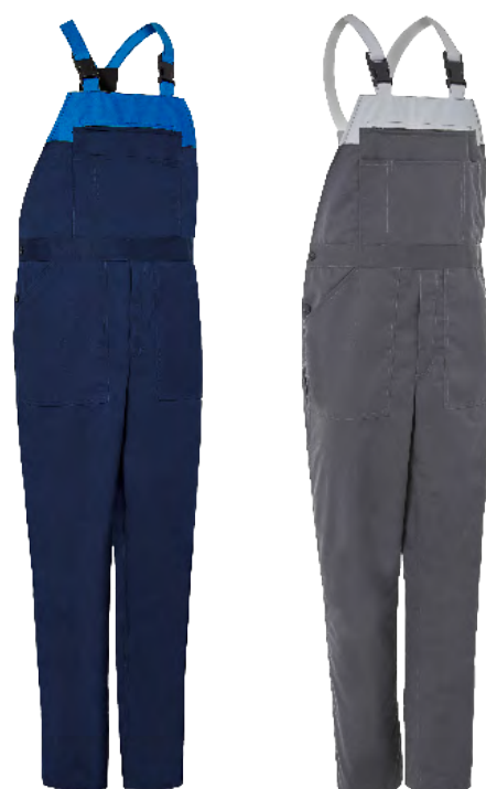
ref. 730 BICOLOR CONFORT FIT