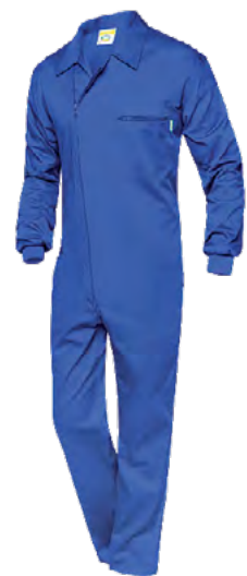
ref. 111 CONFORT FIT