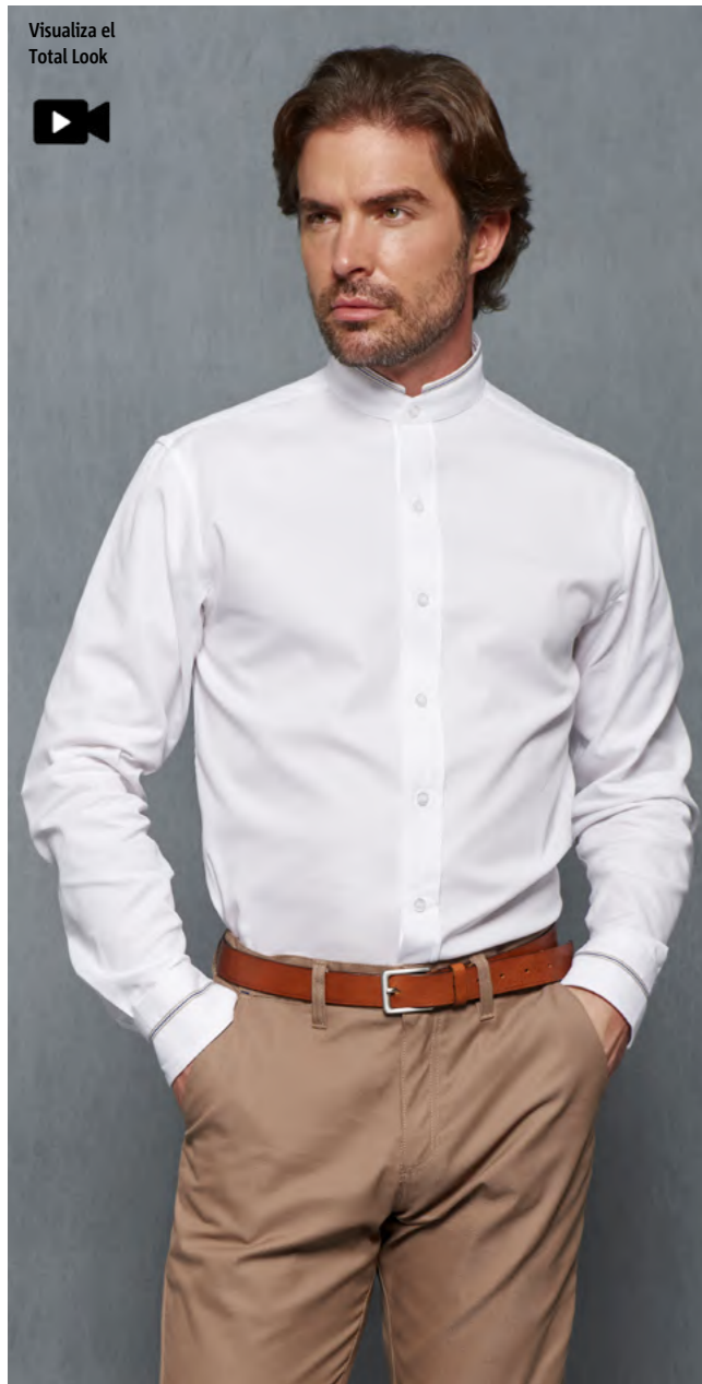
mod. 2042 Camisa cuello mao regular fit 97% Algodón 3% EME · 140gr/m 2