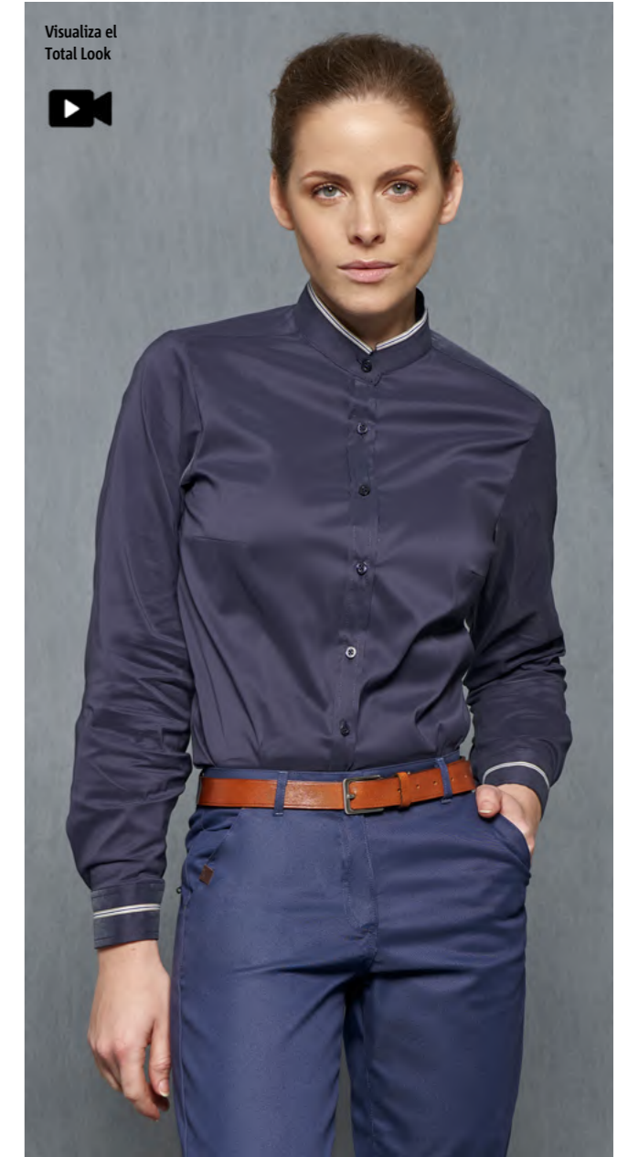
mod. 2038 Camisa cuello mao slim fit • 65% Algodón 35% EME • 108gr/m 2