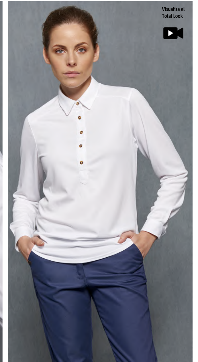
mod. 2259 Camisa polera regular fit · 100% Poliéster · 140gr/m 2