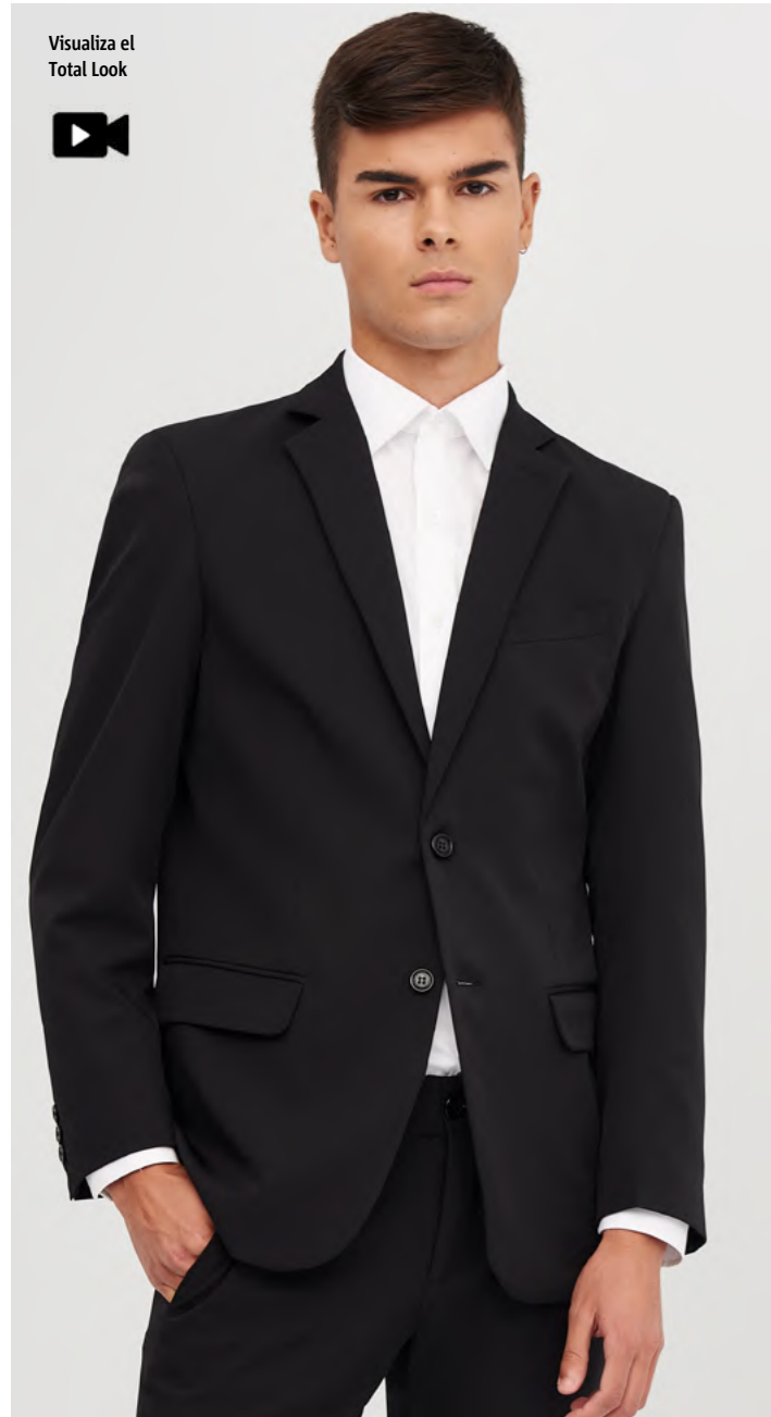
mod. 2141 Camisa slim fit · 75% Poliéster 21% Algodón 4% Elastano · 115gr/m 2 Versión cuello mao: mod. 2139