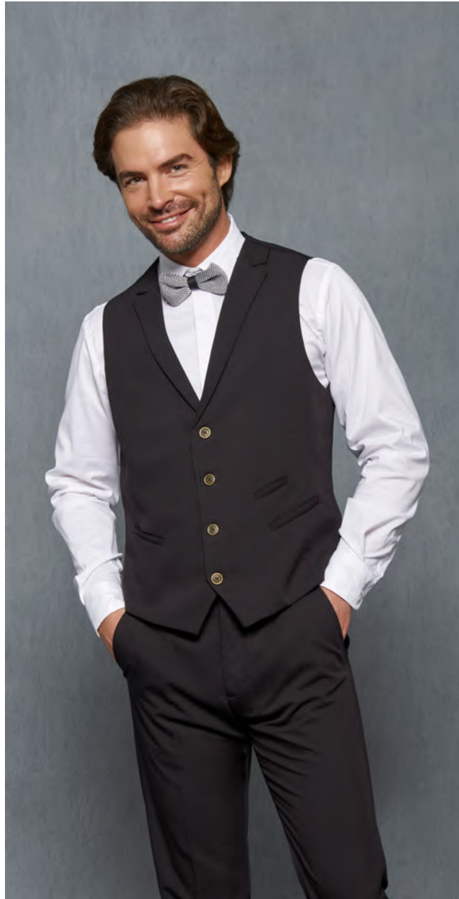
mod. 2035 Camisa cuello italiano regular fit • 65% Algodón 35% EME • 108gr/m 2