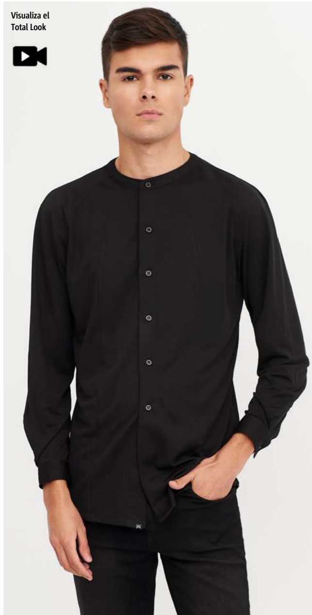
mod. 2137 Camisa punto slim fit 100% Poliéster · 140gr/m 2