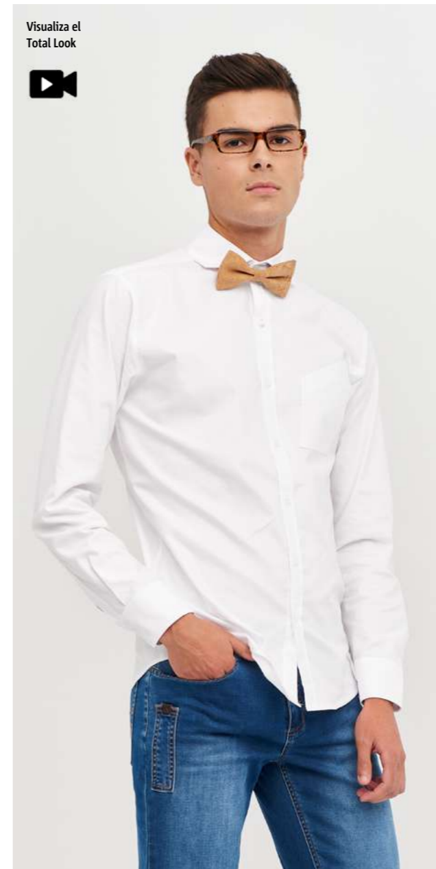
mod. 2040 Camisa cuello kent slim fit · 97% Algodón 3% EME · 158gr/m 2

Estilo oxford con doobby piqué equilibrio perfecto entre una imagen informal y elegante