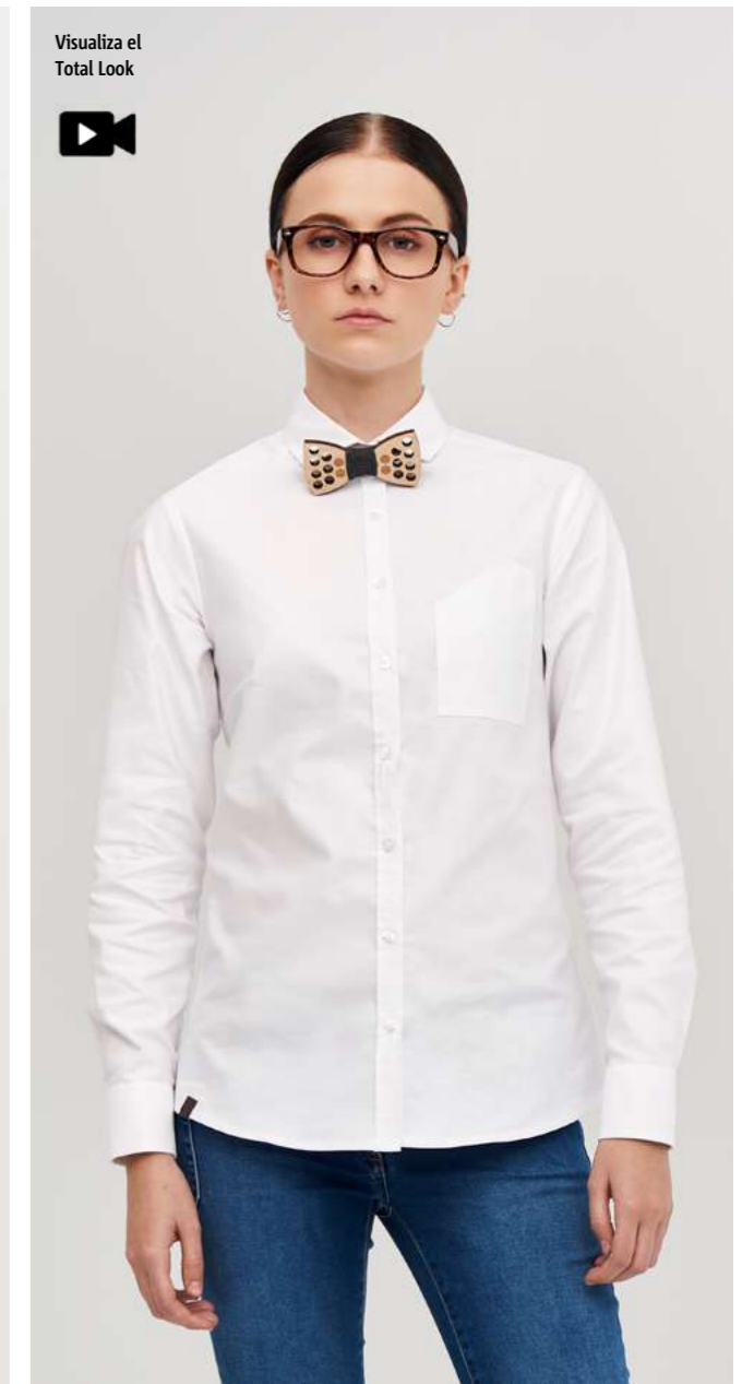
mod. 2041 Camisa cuello kent slim fit · 97% Algodón 3% EME · 158gr/m 2