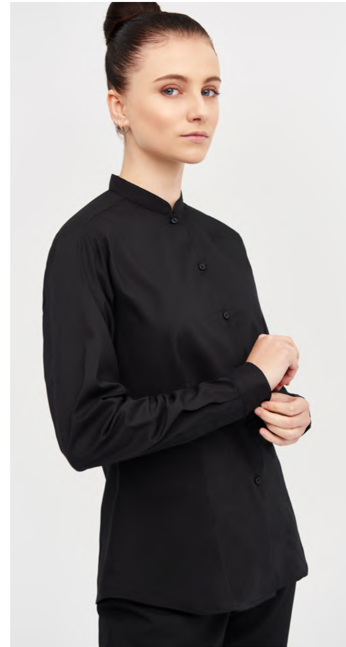
mod. 2255 Camisa slim fit · 75% Poliéster 21% Algodón 4% Elastano · 115gr/m 2 Versión cuello italiano: mod. 2257