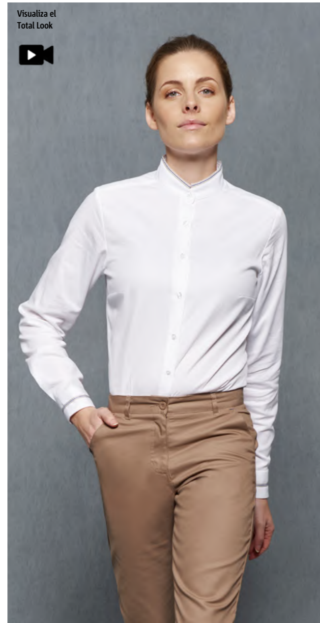
mod. 2043 Camisa cuello mao slim fit 97% Algodón 3% EME · 140gr/m 2

Las más ricas en algodón favoreciendo la transpiración