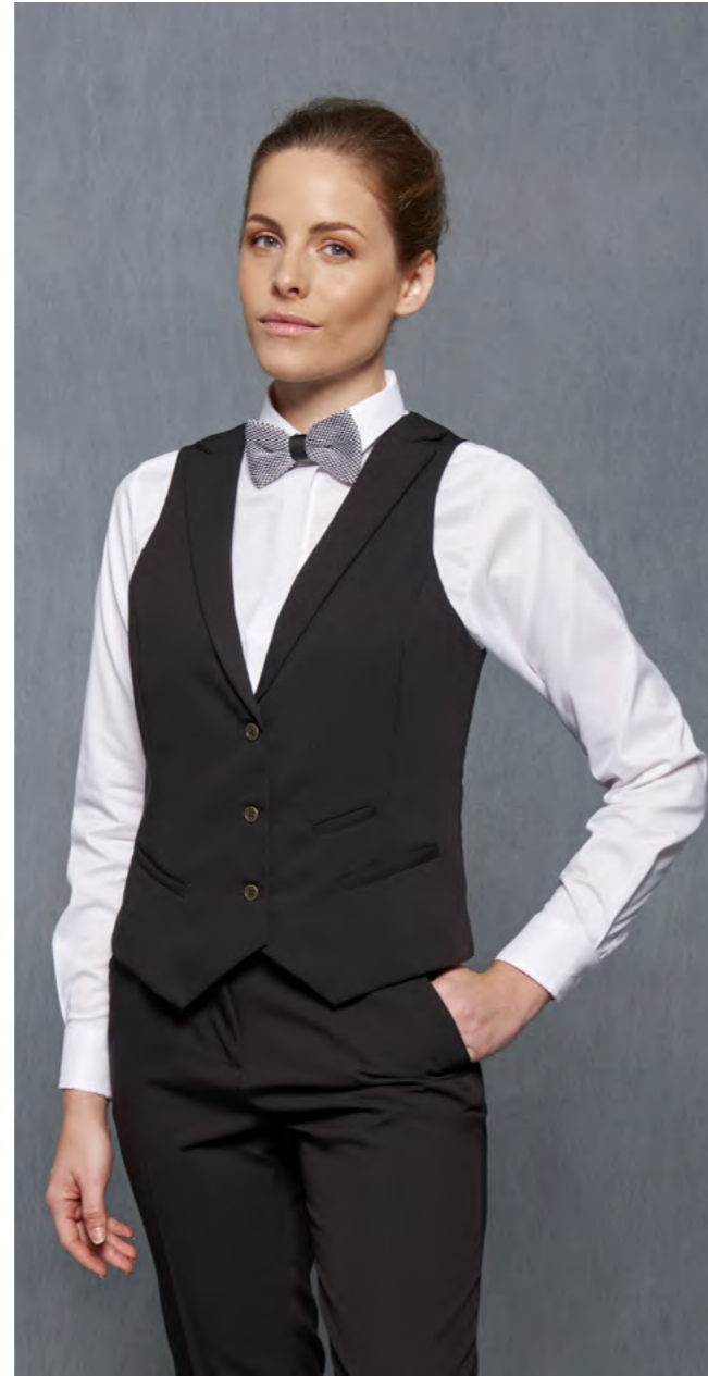
mod. 2036 Camisa cuello italiano regular fit • 65% Algodón 35% EME • 108gr/m 2