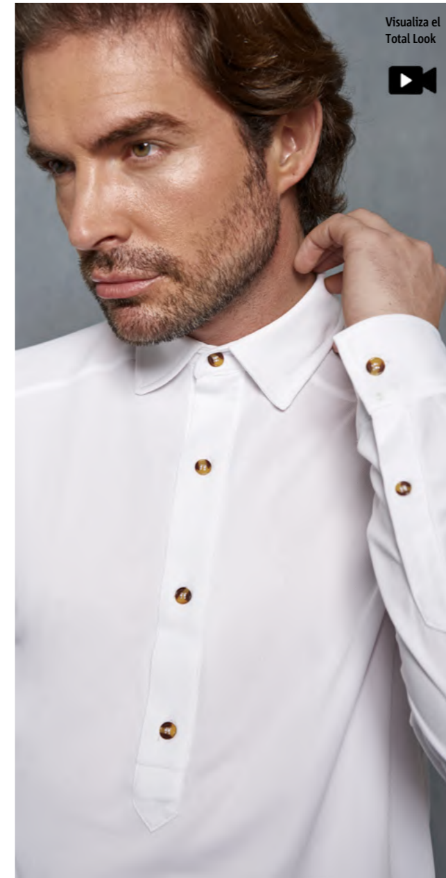
mod. 2143 Camisa polera regular fit · 100% Poliéster · 140gr/m 2