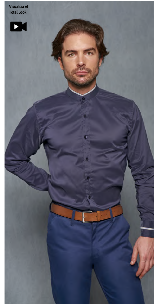
mod. 2037 Camisa cuello mao regular fit • 65% Algodón 35% EME • 108gr/m 2

● Muy cómodas gracias a su bajo gramaje y elasticidad