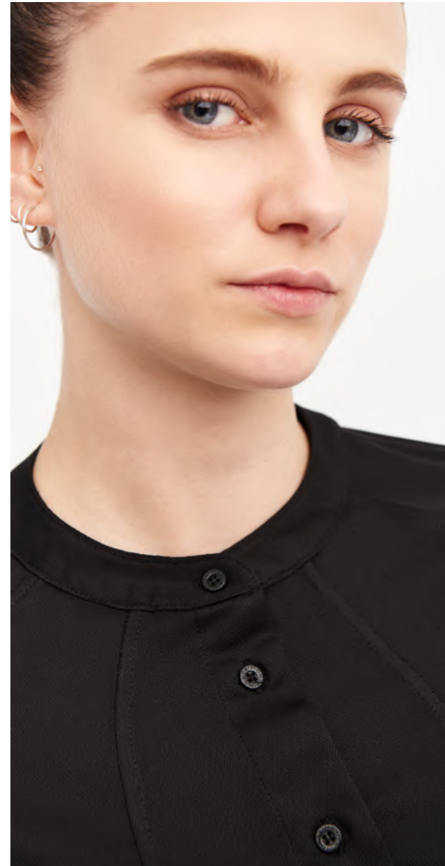
mod. 2253 Camisa punto slim fit 100% Poliéster · 140gr/m 2

Tejido de punto transpirable y con tratamiento antimicrobiano muy cómodo, fluido y de rápido secado