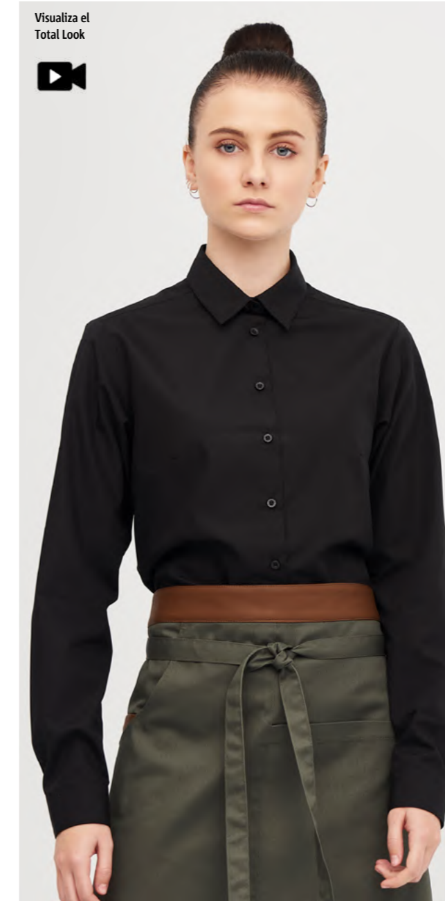
mod. 2250 Camisa manga larga regular fit • 65% Poliéster 35% Algodón • 104gr/m 2