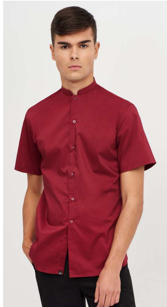
mod. 2140 Camisa slim fit · 75% Poliéster 21% Algodón 4% Elastano · 115gr/m 2 Versión cuello italiano: mod. 2142

Confeccionadas para máximo confort y durabilidad