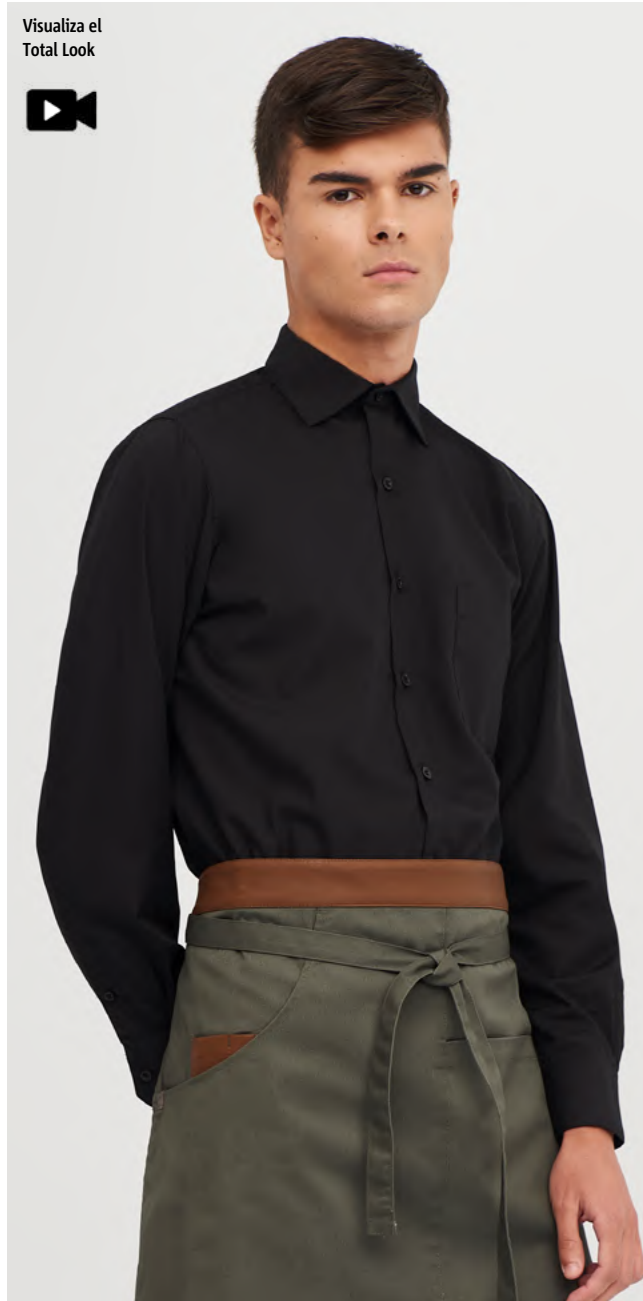
mod. 2030 Camisa manga larga regular fit • 65% Poliéster 35% Algodón • 104gr/m 2