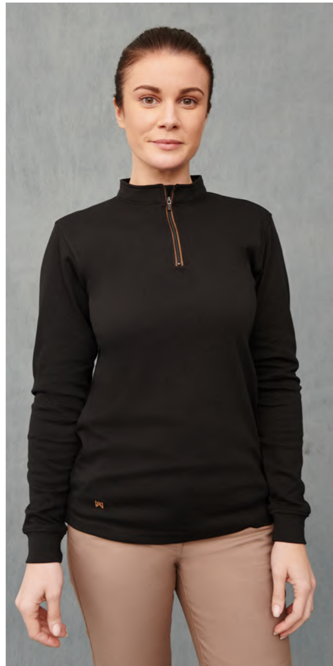
mod. 3035 Polo regular fit · 97% Algodón 3% Elastano · 240gr/m 2