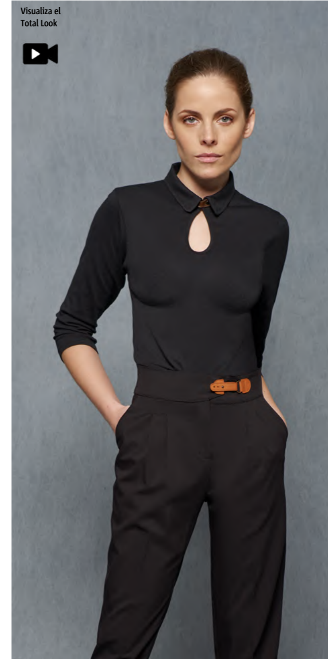
mod. 3036 Polo slim fit · 48% Algodón 47% Modal 5% Elastano · 240gr/m 2