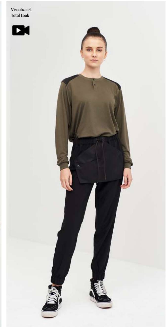
mod. 3019 Camiseta regular fit · 100% Poliéster · 140gr/m 2