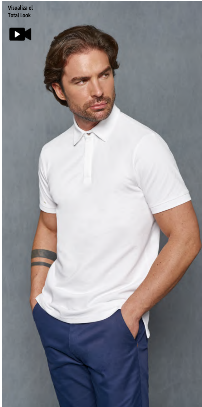
mod. 3034 Polo regular fit · 97% Algodón 3% Elastano · 240gr/m 2