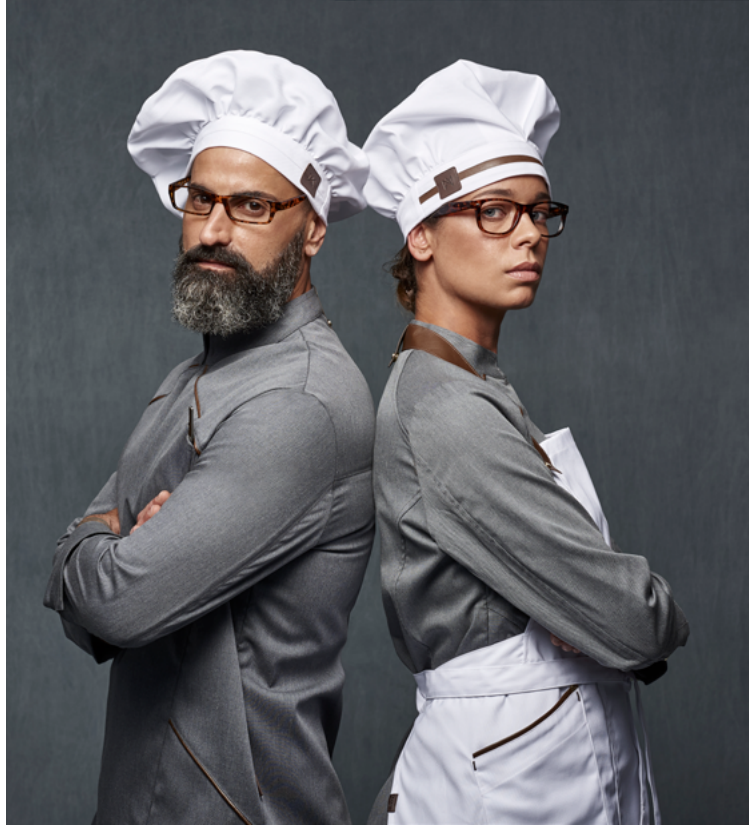
mod. 6289 Gorro champiñón hombre · 65% Poliéster 32% Algodón 3% EOL · 215 gr/m 2 mod. 6231 Gorro champiñón mujer · 65% Poliéster 32% Algodón 3% EOL · 215 gr/m 2