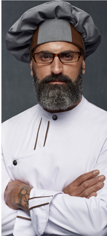
mod. 6288 Gorro champiñón · 65% Poliéster 32% Algodón 3% EOL · 215 gr/m 2