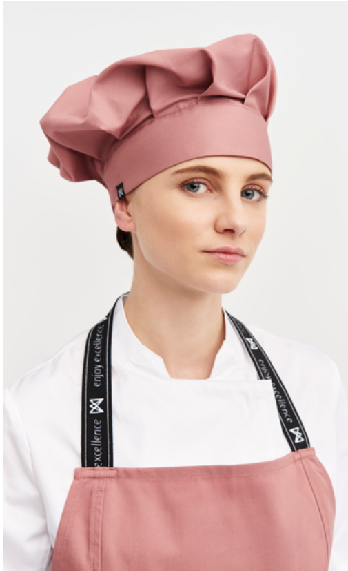
mod. 6419 Delantal peto goma elástica · 65% Poliéster 35% Algodón · 240 gr/m 2