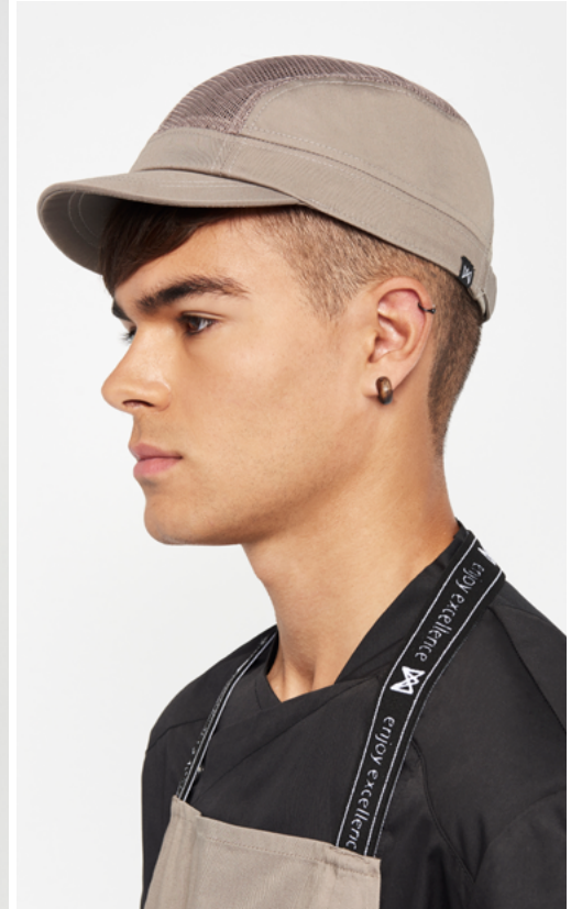
mod. 6422 Delantal francés abierto · 65% Poliéster 35% Algodón · 240 gr/m 2