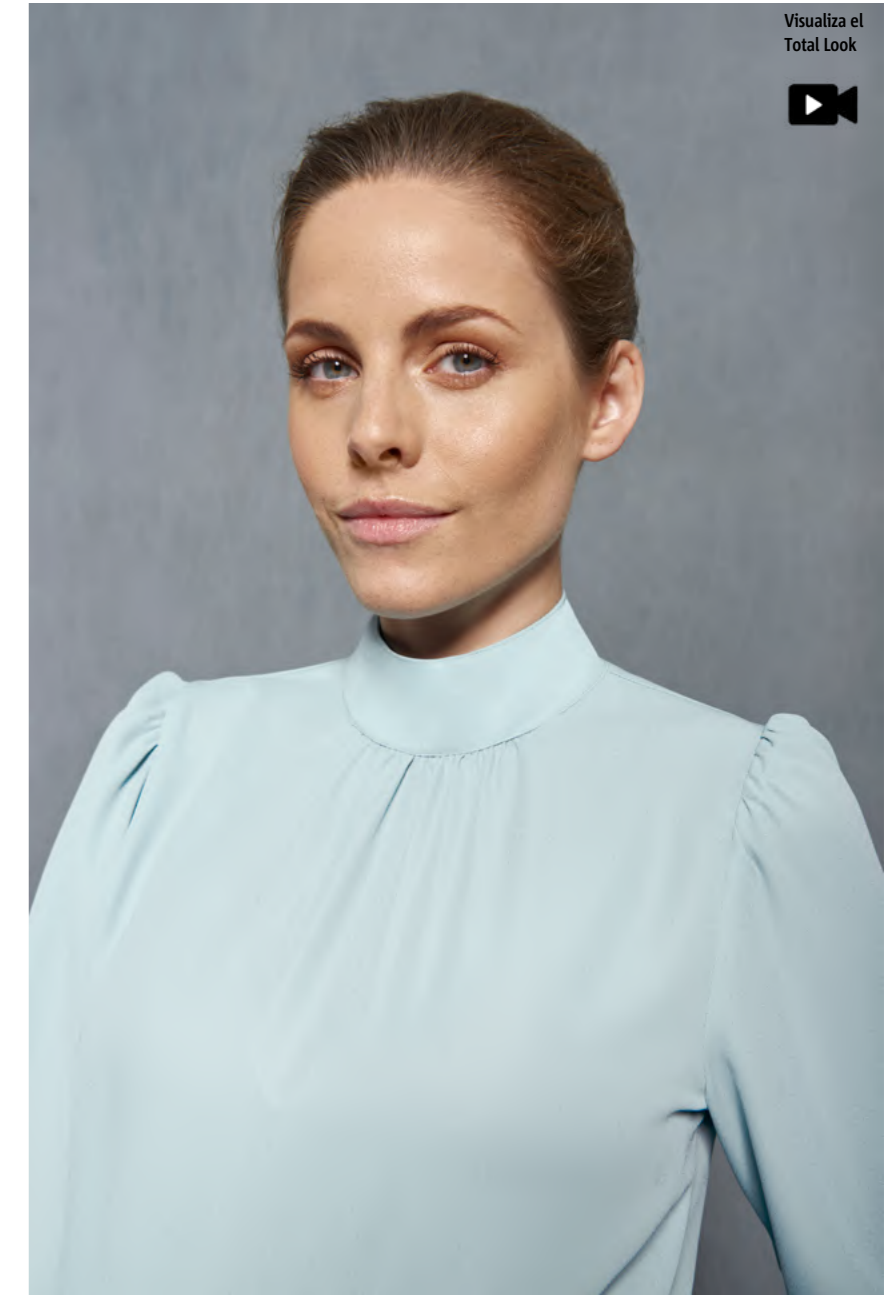
mod. 2247 Blusa regular fit · 100% Poliéster · 120gr/m 2

Tejido Crepe Georgette: fluido y con caída ● Diseño muy favorecedor y tendencia