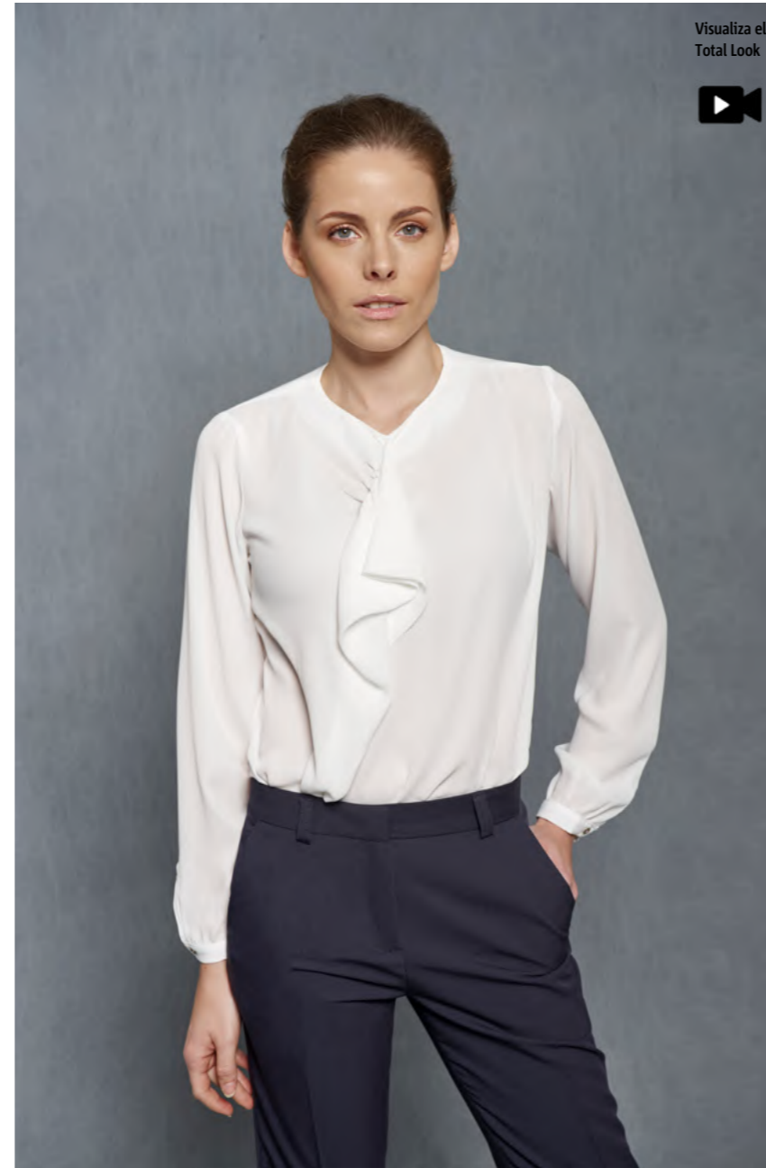
mod. 2246 Blusa regular fit · 100% Poliéster · 120gr/m 2

Blusas llenas de posibilidades para diseñar #TotalLooks en todos los ambientes