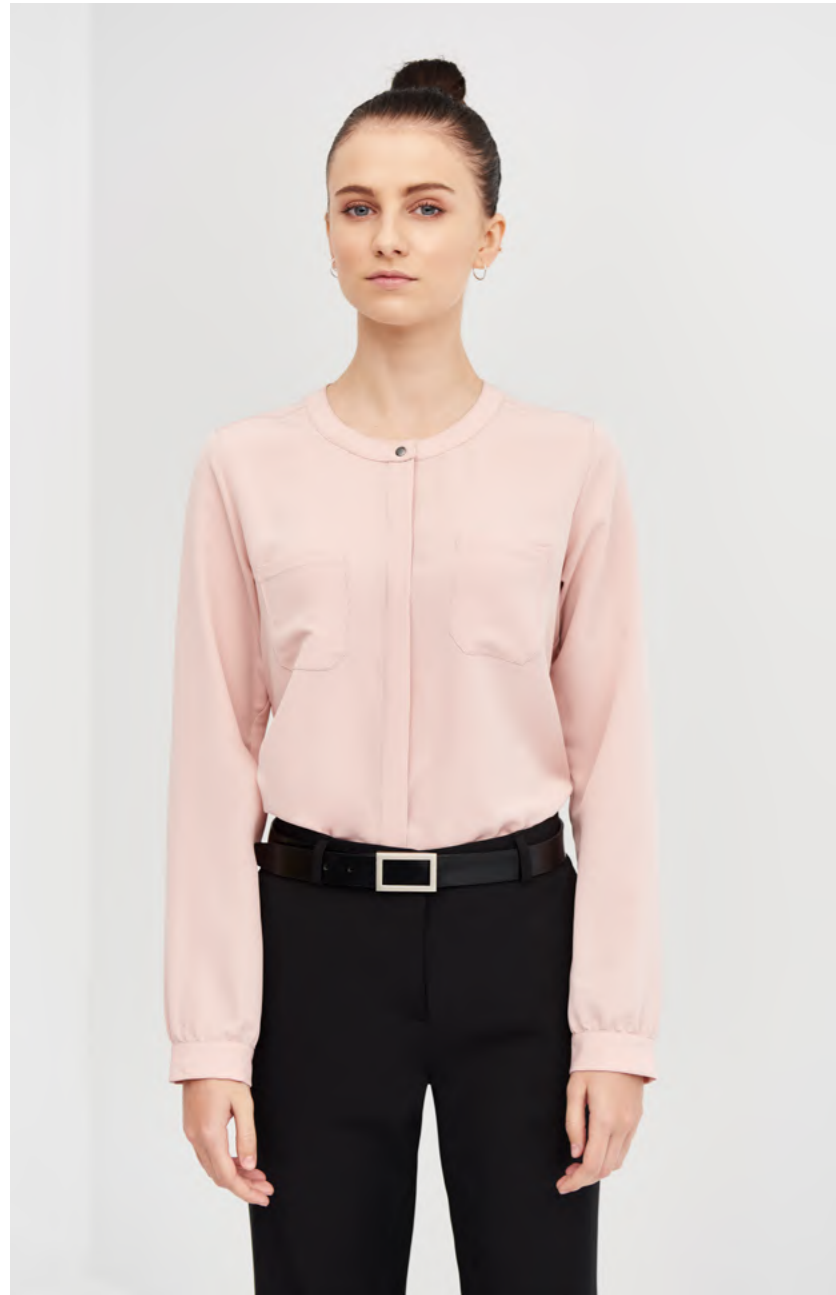
mod. 2245 Blusa regular fit · 100% Poliéster · 115gr/m 2

Blusas llenas de posibilidades para diseñar #TotalLooks en todos los ambientes